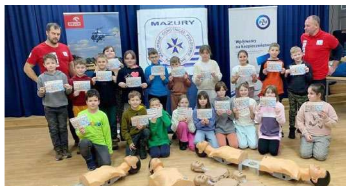
Przyjemne z pożytecznym - dzieci i zadowolone, i bogatsze o bezcenną wiedzę. Szkolenia prowadzone przez ratowników MOPR rozpoczęły się w styczniu i potrwać do połowy wiosny

Cykliczne spotkania MOPR-owców z uczniami giżyckich podstawówek planowane są do końca kwietnia.