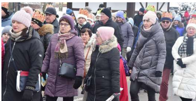
Fot. Bogusław Zawadzki