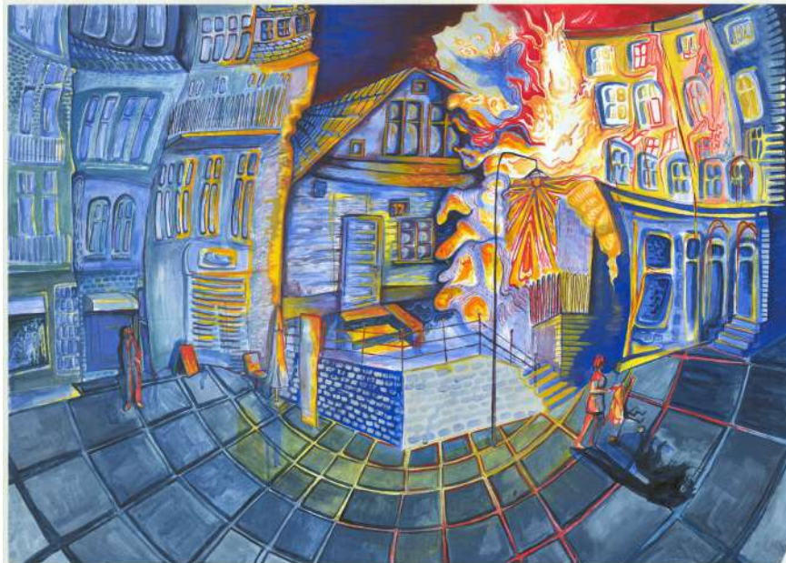
Rys. Lena Darska

Poza tym funkcjonuje cała sfera edukacji kulturalnej, tak pochopnie zarzuconej przez oficjalne placówki edukacyjne w początkach naszej przygody z popeerelewskim kapitaliz-