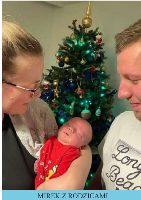
MIREK Z RODZICAMI