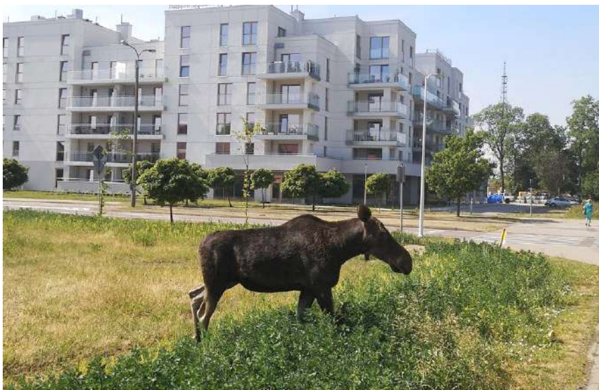
Goście z lasu ostatnio coraz częściej zapędzają się do miasta. Temu osobnikowi do gustu przypadła zieleń przy alei 1 Maja

W połowie stycznia władze Miasta i Powiatu Giżyckiego wystosowały pismo adresowane do szefowej Ministerstwa Klimatu i Środowiska Pauliny Hennig - Kloski . Czytamy w nim m.in.: "Zwracamy się do Pani Minister w wnioskiem o zainicjowanie działań związanych z uregulowaniem problematyki procedur postępowania z dzikimi zwierzętami, żyjącymi w stanie wolnym i coraz częściej pojawiającymi się na terenach zabudowanych. Uważamy, że w całym kraju, ale szczególnie w takich regionach jak nasz, od kilku lat problem obecności dzikich zwierząt na terenach zurbanizowanych narasta. Łosie, sarny, jelenie czy dziki pojawiają się regularnie na ulicach, osiedlach, ogrodach działkowych i placach ogólnodostępnych naszego miasta. Stwarza to duże zagrożenie dla